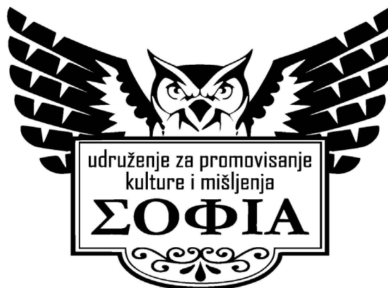
Logo udruženja Sofia

Primarni ciljevi udruženja jesu sljedeći: razvoj i afirmacija filozofskih, naučnih i kulturnih vrijednosti BiH društva, te razvoj svestrane eduko-