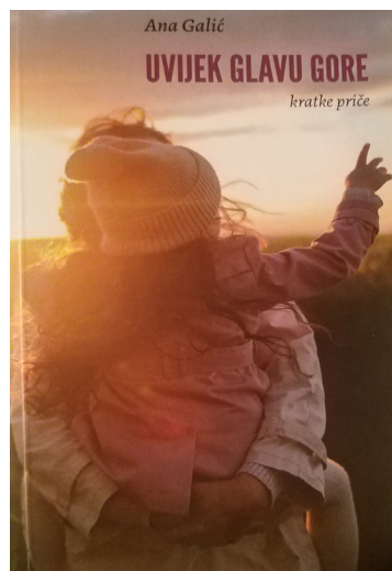
Zbirka kratkih priča „Uvijek glavu gore“ (Banja Luka, Udruženje “Sofia”, 2019)

besmislu koje nas sa svih strana okružuje.