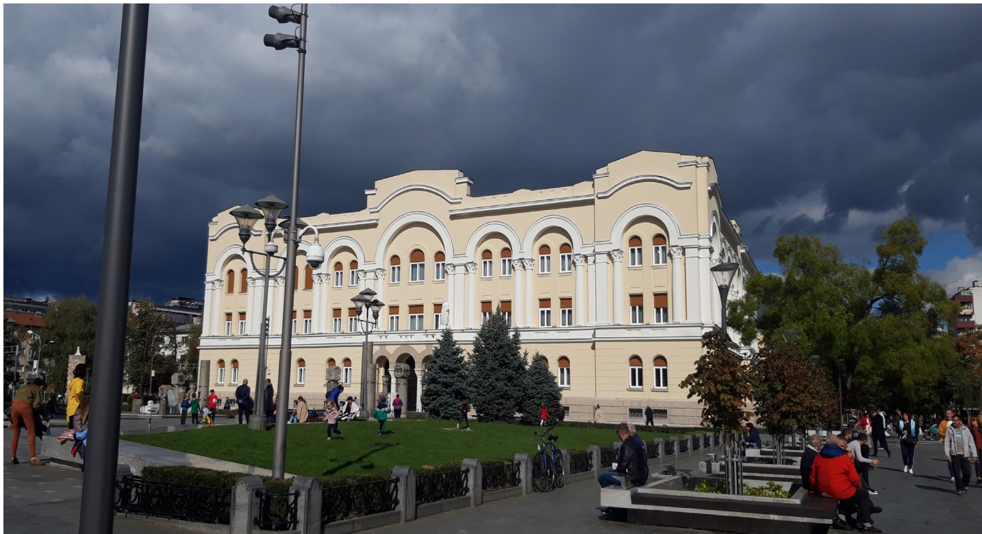
Banski Dvor, Banja Luka

padništvo ovim ili onim kulturnim miljeima ne određuje ko se s kim treba družiti ili sarađivati zajedno. S druge strane, majka me je odgojila u duhu tradicije, uvažavanja i očuvanja svega onog što je činilo njen život, vjeru i pripadnost njenom narodu njoj bitnim, tako da meni nije preostalo ništa drugo nego da ujedinem ta dva uticaja. Polazim od svojih korijena i idem dalje, u svijet, sa željom da naučim što je više moguće i da to znanje prenesem dalje.